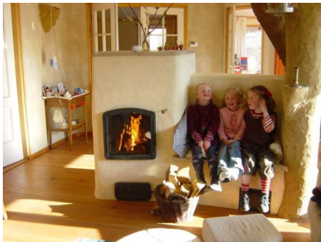
weldadige infrarood stralingswarmte in huis.

stelling tot de traditionele cv installaties i.c.m. radiatoren, tegenwoordig nog maar mondjesmaat toegepast voor verwarming in gebouwen. Dit is toch merkwaardig, omdat infrarood stralingssystemen m.b.t. gezondheid, comfort, energie en kosten vele voordelen kent t.o.v. convectiesystemen.