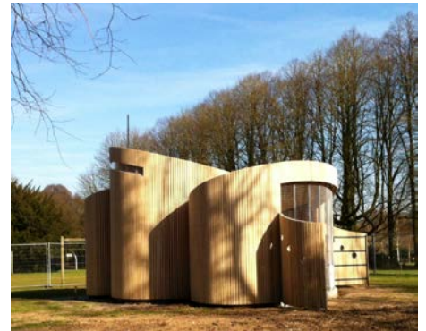
Bio-Based Bijen Paviljoen ontwerp: Marcus Architecten

voor het gebouw waren de aanleiding tot de vorming van de plattegrond, deze is geïnspireerd op de geleiding van een insect. De open zuid-façade biedt zoveel mogelijk zonkracht op de bijenkasten. Het dak van het hogere deel, met leslokaal en bezoekersruimte, is gericht op daglicht en energie.