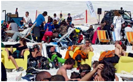
zonnebaden bij temperaturen onder nul

Na VIBA-café van 5 februari 2015, met de presentatie van het boek "Stralingsverwarming, gezonde warmte met minder energie" en de lezing over infrarood verwarming door Kris De Decker van Lowtech Magazine en Sietz Leeflang van De Twaalf Ambachten, is de werkgroep STRALINGSWARMTE in het leven geroepen.